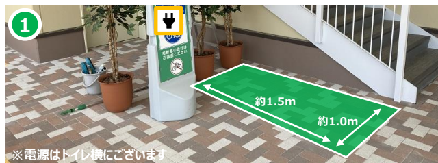
※電源はトイレ横にごさいます